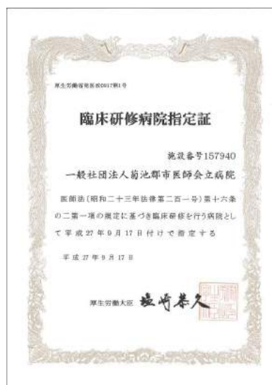
[臨床研修病院指定証]

私たちもこの機会に医師会の先生方をはじめとして、コメディカルスタッフや行政などと協力して、若い医師を育てる使命を果たしていかなければなりません。