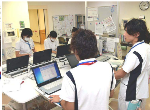
▲ ミーティングの様子