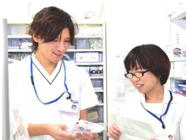
▲ 薬剤のダブルチェック

まだまだ、不十分で行き届かないところもあると思います。患者さまやご家族とのコミュニケーションを大切に臨んで行きたいと考えております。